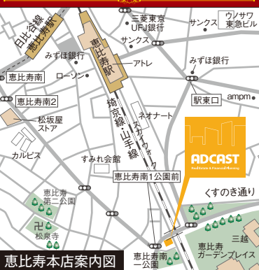
恵比寿本店案内図