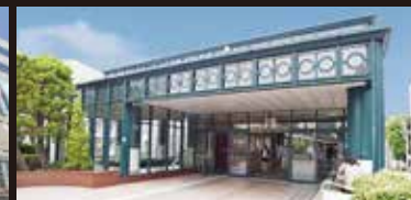
恵比寿スカイウォーク出入口(現地より約560m)