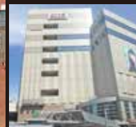
アトレ恵比寿(現地より約890m)