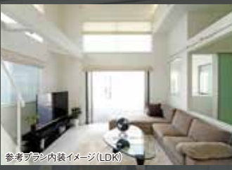
参考プラン内装イメージ(LDK)

※「建築条件付売地」とは、土地売買契約後に売主または売主の指定する建築業者との間に建築請負契約を3ヶ月以内に締結することを条件として販売いたします。この期間内に建築しないことが確定したとき、又は建築請負契約が成立しなかった場合は土地売買契約は白紙となり、受領した金銭は全額返却されます。