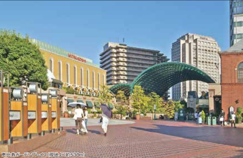
恵比寿ガーデンプレイス(現地より約530m)