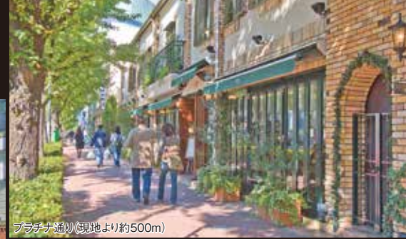
プラチナ通り(現地より約500m)