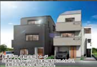
※参考プランは本宅地分譲における 参考のための一例であり、 採用するか否かは 購入者の自由です。