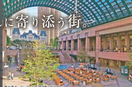
恵比寿ガーデンプレイス(現地より約710m)