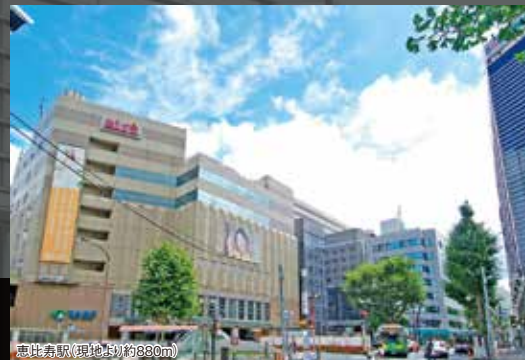
恵比寿駅(現地より約880m)